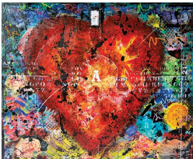
La lumière du cœur, toile créée par les enfants du Phare en collaboration avec Jean-Daniel Rohrer